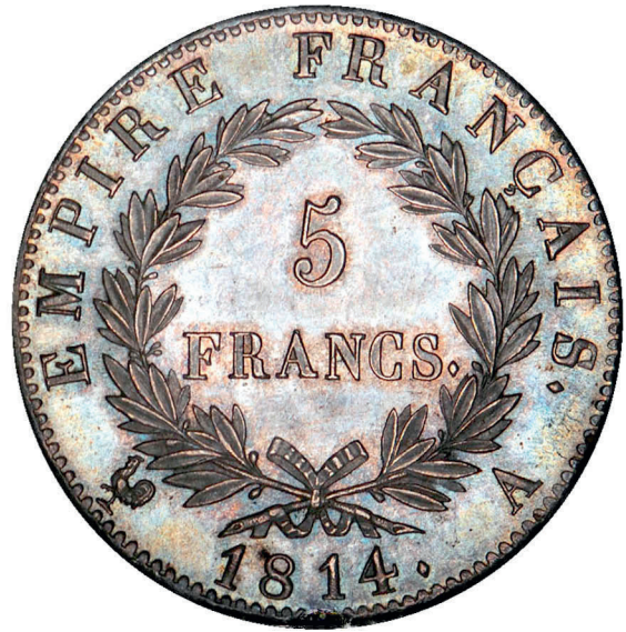
207 - GROSSISSEMENT X 2