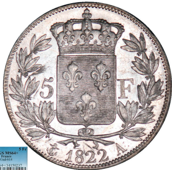
217 - GROSSISSEMENT X 2