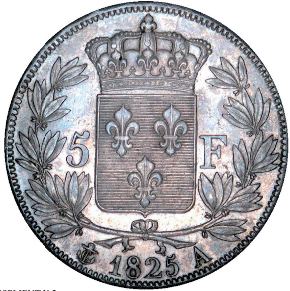
221 - GROSSISSEMENT X 2