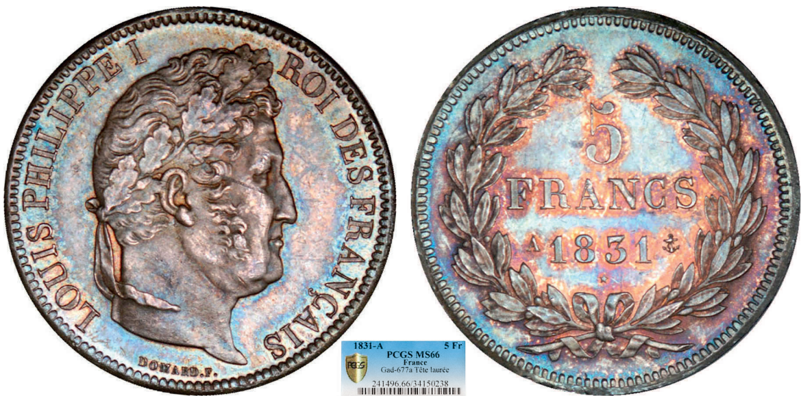
236 - GROSSISSEMENT X 2