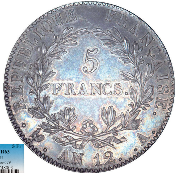
194 - GROSSISSEMENT X 2