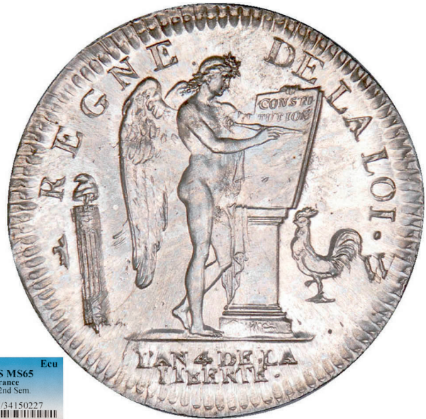
177 - GROSSISSEMENT X 2