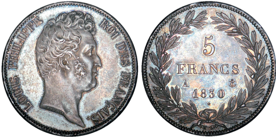
228 - GROSSISSEMENT X 2