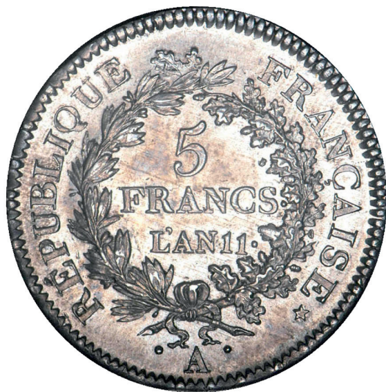
191 - GROSSISSEMENT X 2