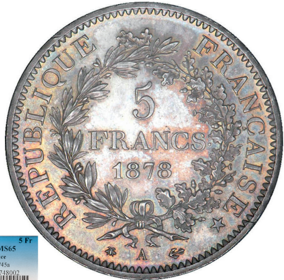
297 - GROSSISSEMENT X 2

1878-A 5 Fr PCGS MS65 France Gad-745a 4059256588748002