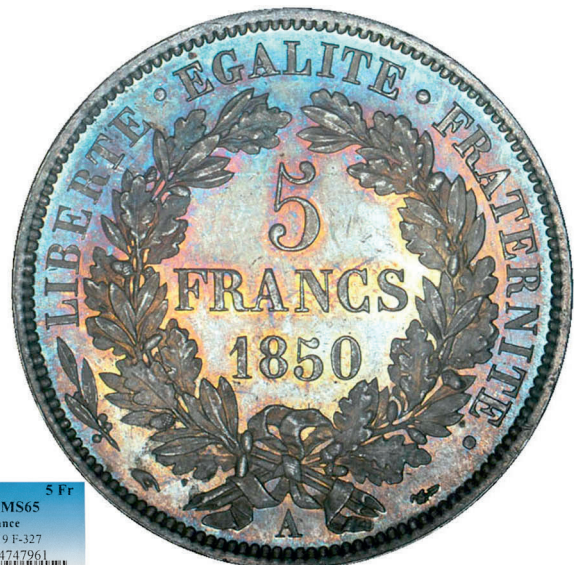
260 - GROSSISSEMENT X 2

1850-A 5 Fr PCGS MS65 France Gad-719 F-327 156594.65/84747961