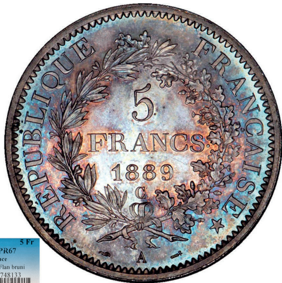
298 - GROSSISSEMENT X 2

1889-A 5 Fr PCGS PR67 France Gad-745a Plan bruni 1567726788748133