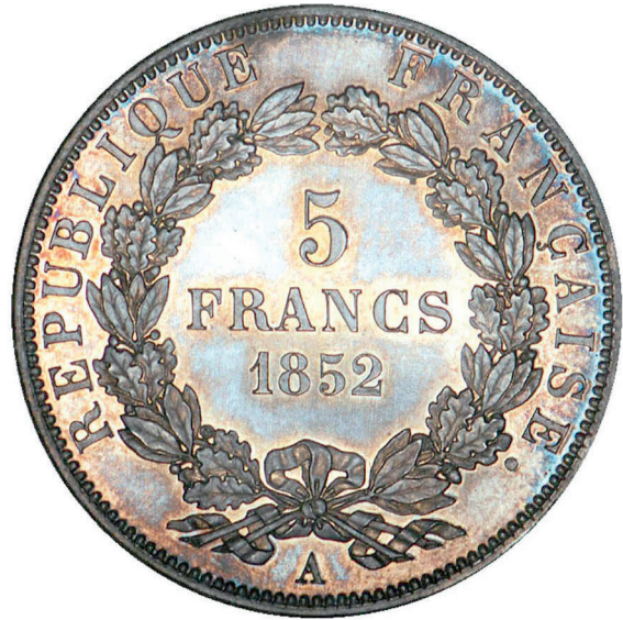
263 - GROSSISSEMENT X 2