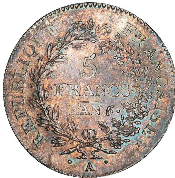
186 - GROSSISSEMENT X 2