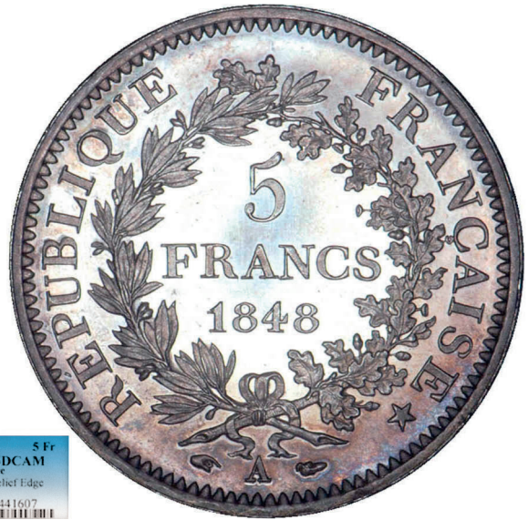
256 - GROSSISSEMENT X 2

1848-A Essai 5 Fr PCGS PR65DCAM France Maz-121 la Relief Edge 507362.65/34441607