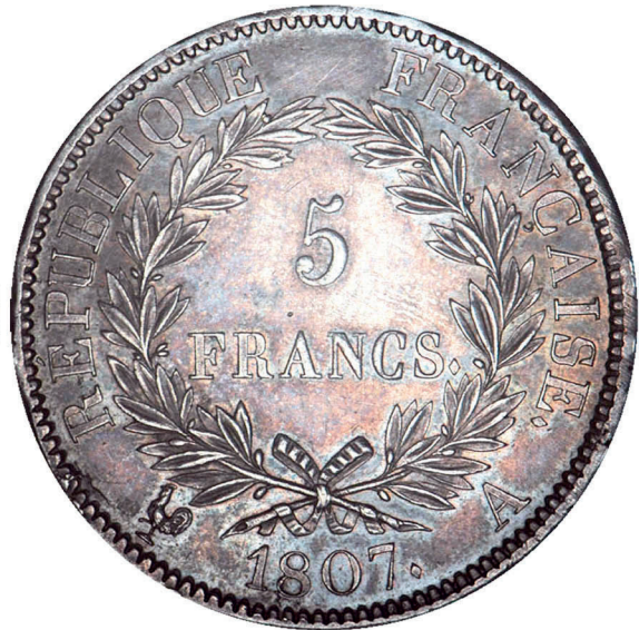
199 - GROSSISSEMENT X 2