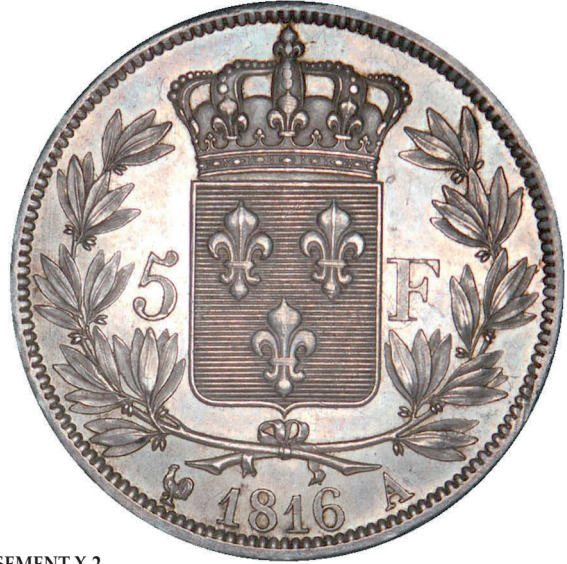
211 - GROSSISSEMENT X 2