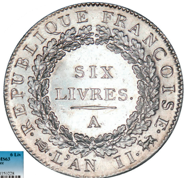
180 - GROSSISSEMENT X 2