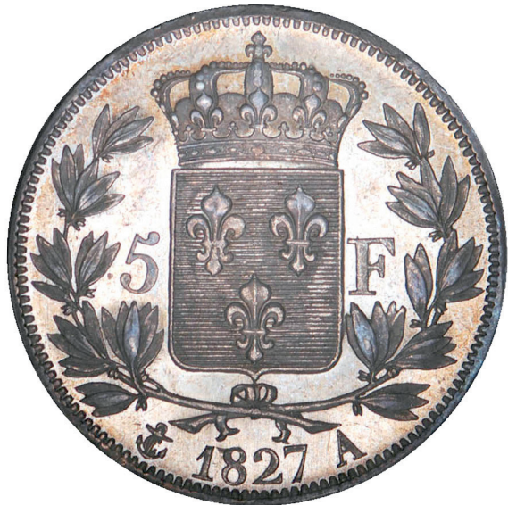
223 - GROSSISSEMENT X 2