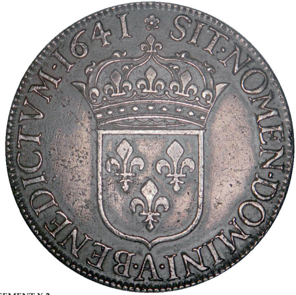
1 - GROSSISSEMENT X 2