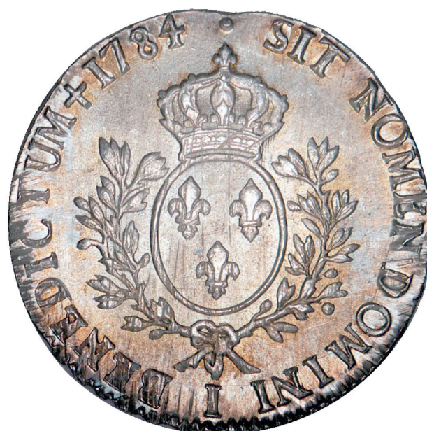
164 - GROSSISSEMENT X 2