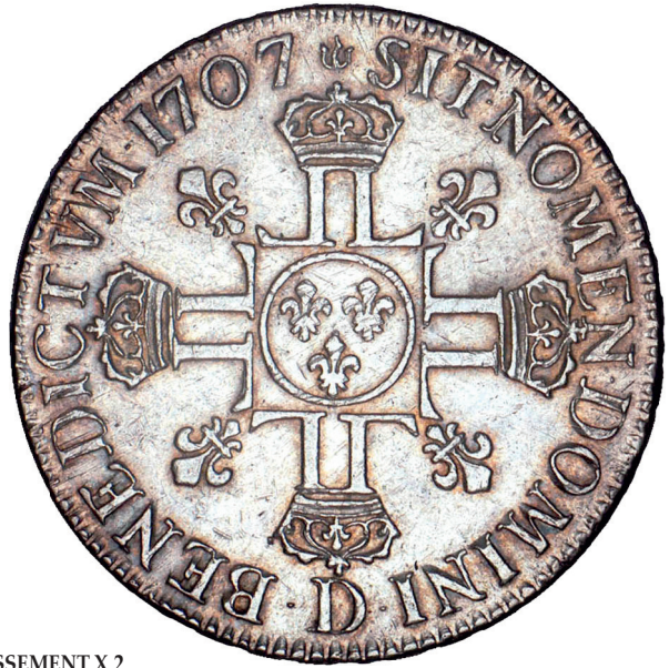
76 - GROSSISSEMENT X 2