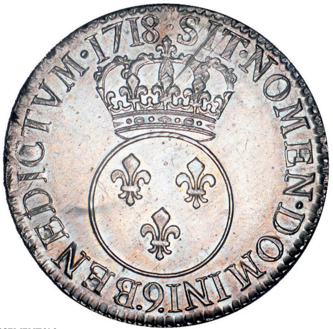
90 - GROSSISSEMENT X 2