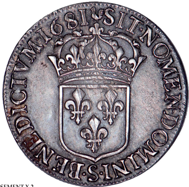
44 - GROSSISSEMENT X 2