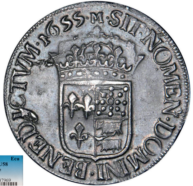
16 - GROSSISSEMENT X 2