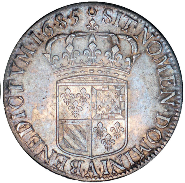
49 - GROSSISSEMENT X 2