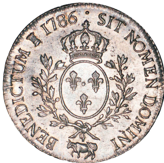
166 - GROSSISSEMENT X 2