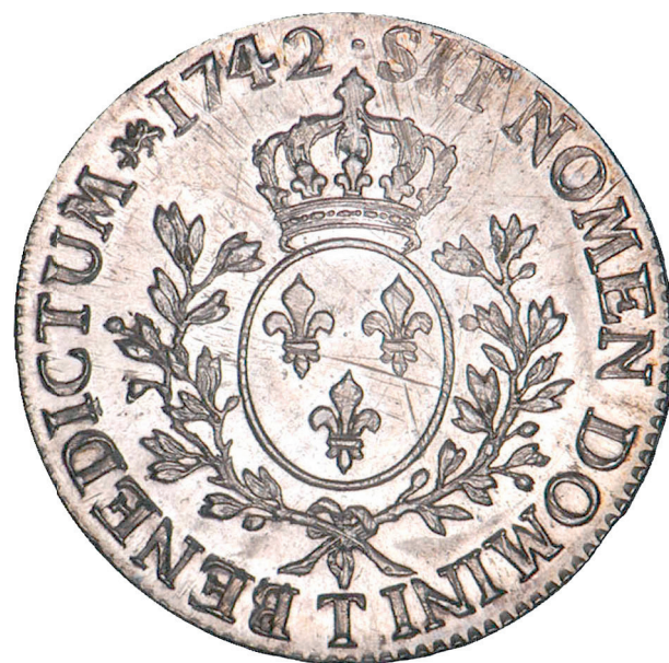
118 - GROSSISSEMENT X 2