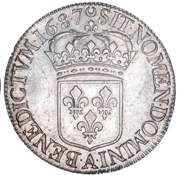
52 - GROSSISSEMENT X 2