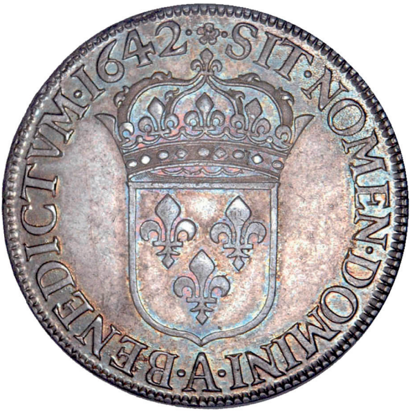
2 - GROSSISSEMENT X 2