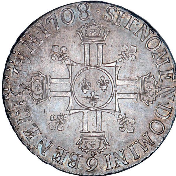
77 - GROSSISSEMENT X 2