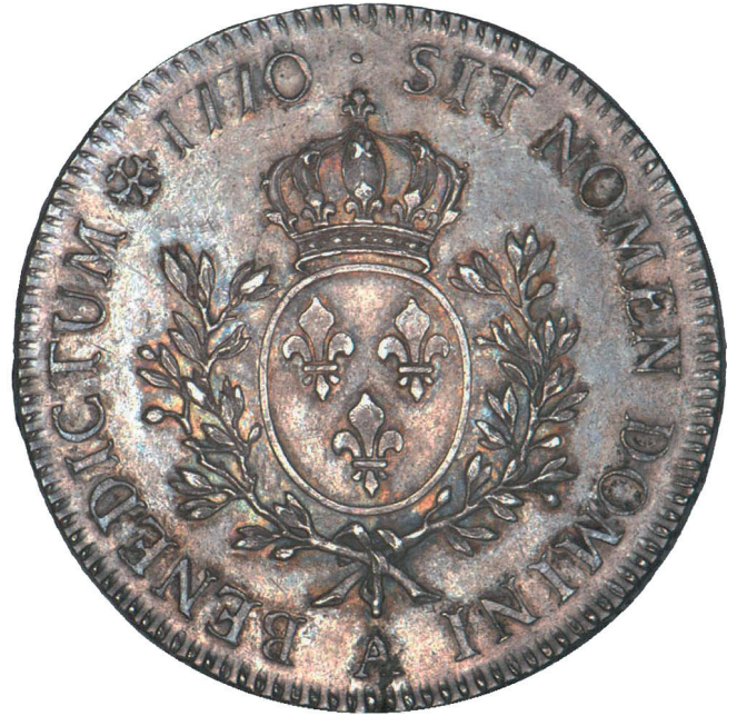
147 - GROSSISSEMENT X 2