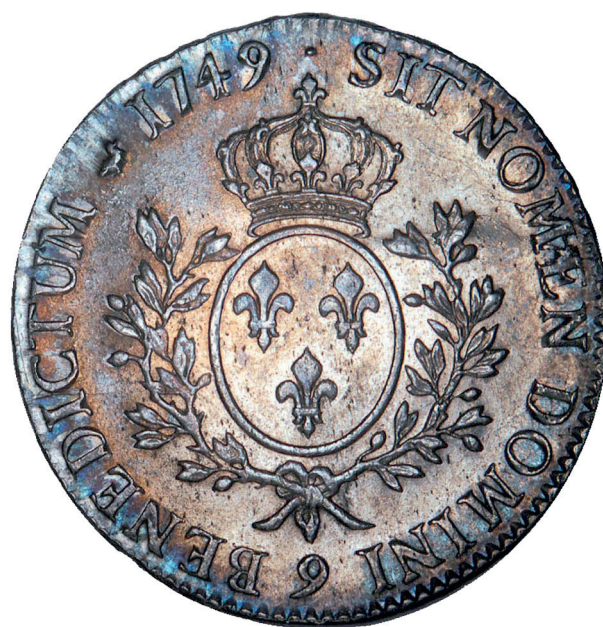
125 - GROSSISSEMENT X 2