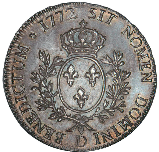
151 - GROSSISSEMENT X 2